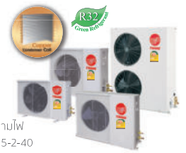
Terminal Block ในคอนเดนซิ่งเป็นชนิดไม่ลามไฟ และผ่านมาตรฐาน IEC60335-2-40

พร้อมด้วย Condensing Unit ที่มีมาตรฐานการทำงานสูง รับประกันคุณภาพคอมเพรสเซอร์นานถึง 7 ปี