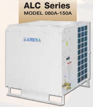
ALC Series MODEL 080A-150A