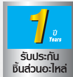
APK Series MODEL 080A-150A