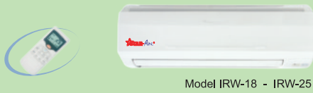
Model IRW-18 - IRW-25