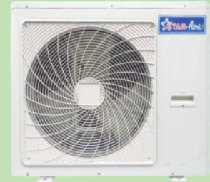
Model OR33 - OR40 Model OR33-3 - OR40-3