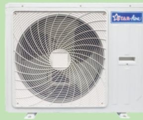
Model OR18 - OR30