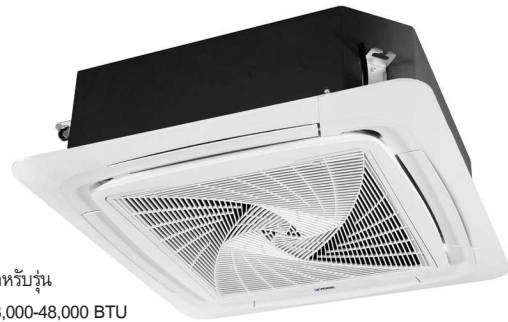
สำหรับรุ่น 18,000-48,000 BTU