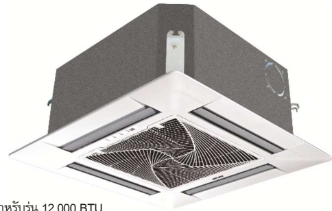
สำหรับรุ่น 12,000 BTU